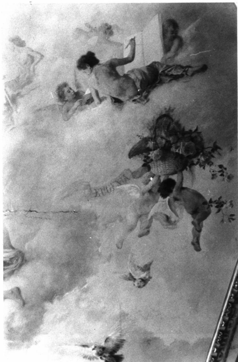
Alegoría de la Literatura.