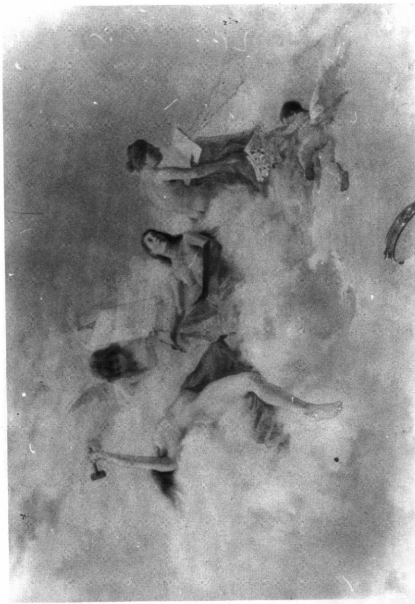
Alegoría de las Artes plásticas.