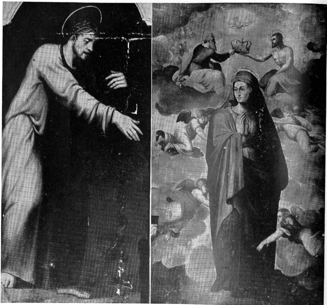
Lám. II—Antonio de Alfián. Fig. 1.—Retablo de Cristo. Cristo camino del Calvario . Fig. 2.—Retablo de la Virgen. Coronación de la Virgen . Osuna. Parroquia de Santo Domingo.