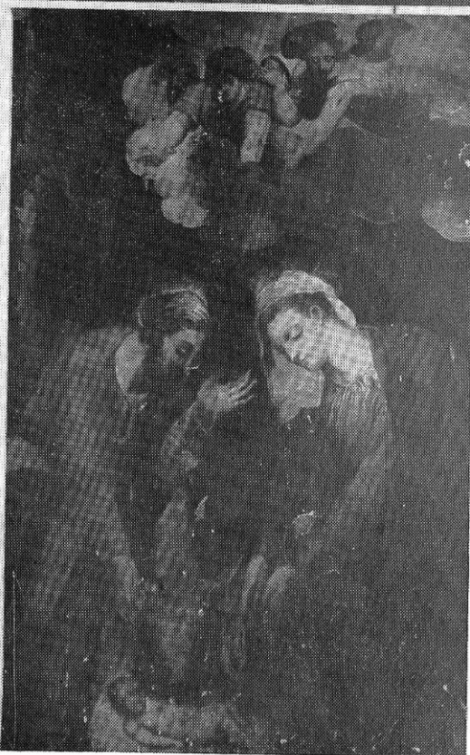
Lám. III—Antonio de Alfión. Retablo de la Virgen . Fig. 1.— La Anunciación . Fig. 2.— Visitación . Fig. 3.— Juicio Final . Fig. 4.— Nacimiento . Osuna. Parroquia de Santo Domingo.