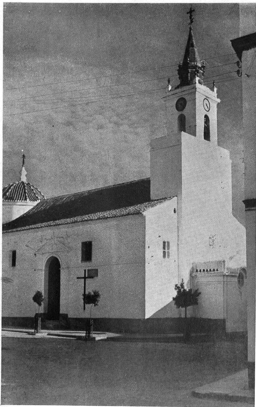
Iglesia Parroquial (Santa María la Blanca) de Villanueva del Ariscal (Sevilla),