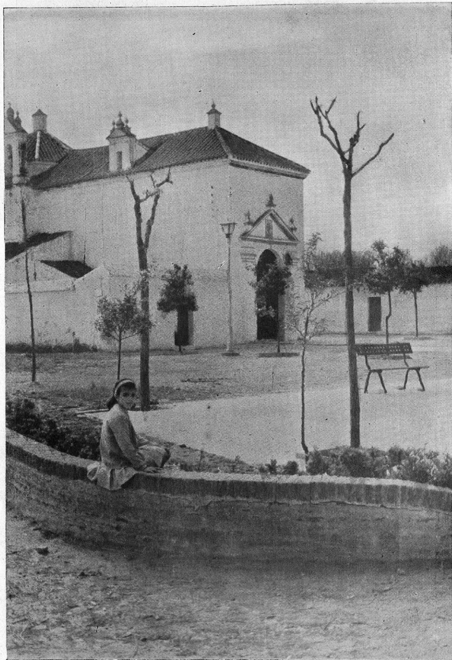
Ermita de Villanueva del Ariscal (Sevilla)