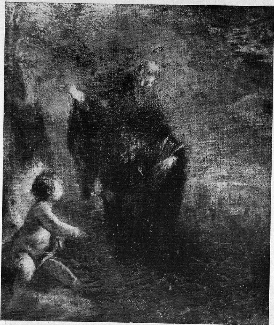
San Agustín con el Niño en la playa. Pintura del Convento del Corpus Christi en Madrid.