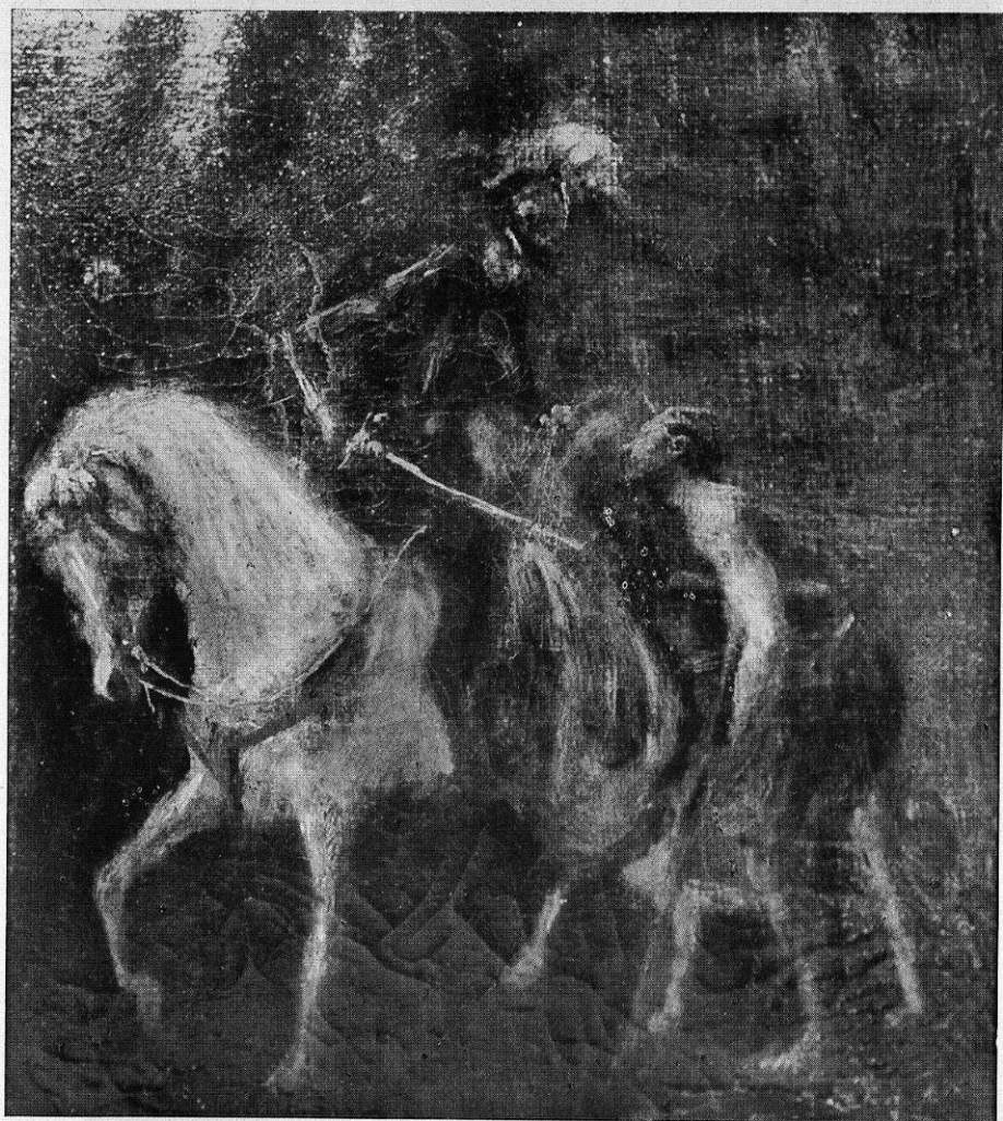
San Martín, partiendo su capa con el pobre. Pintura del Convento del Corpus Christi de Madrid.