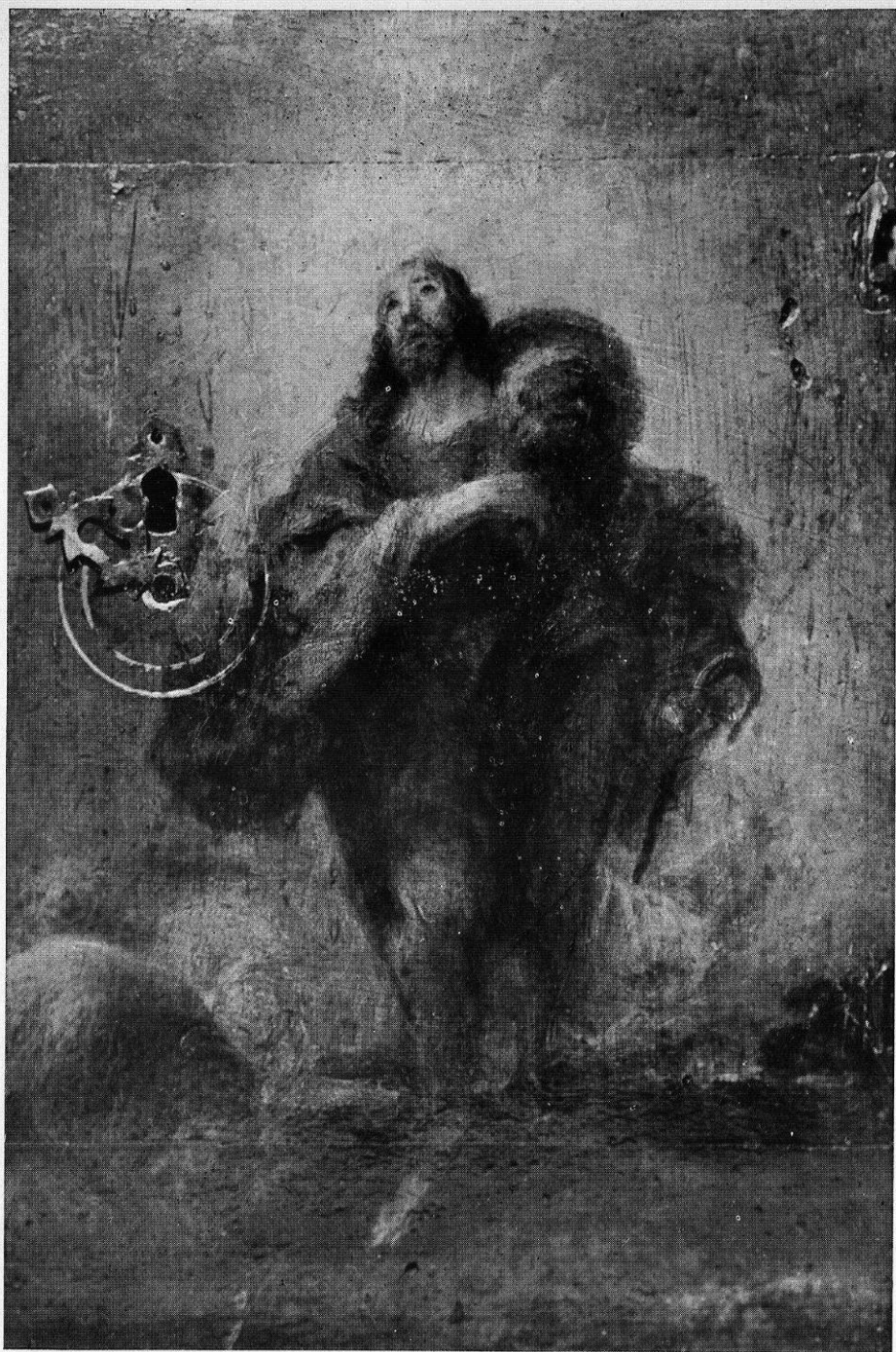
El Buen Pastor, en la puerta del sagrario. — Pintura del Convento del Corpus Christi de Madrid.