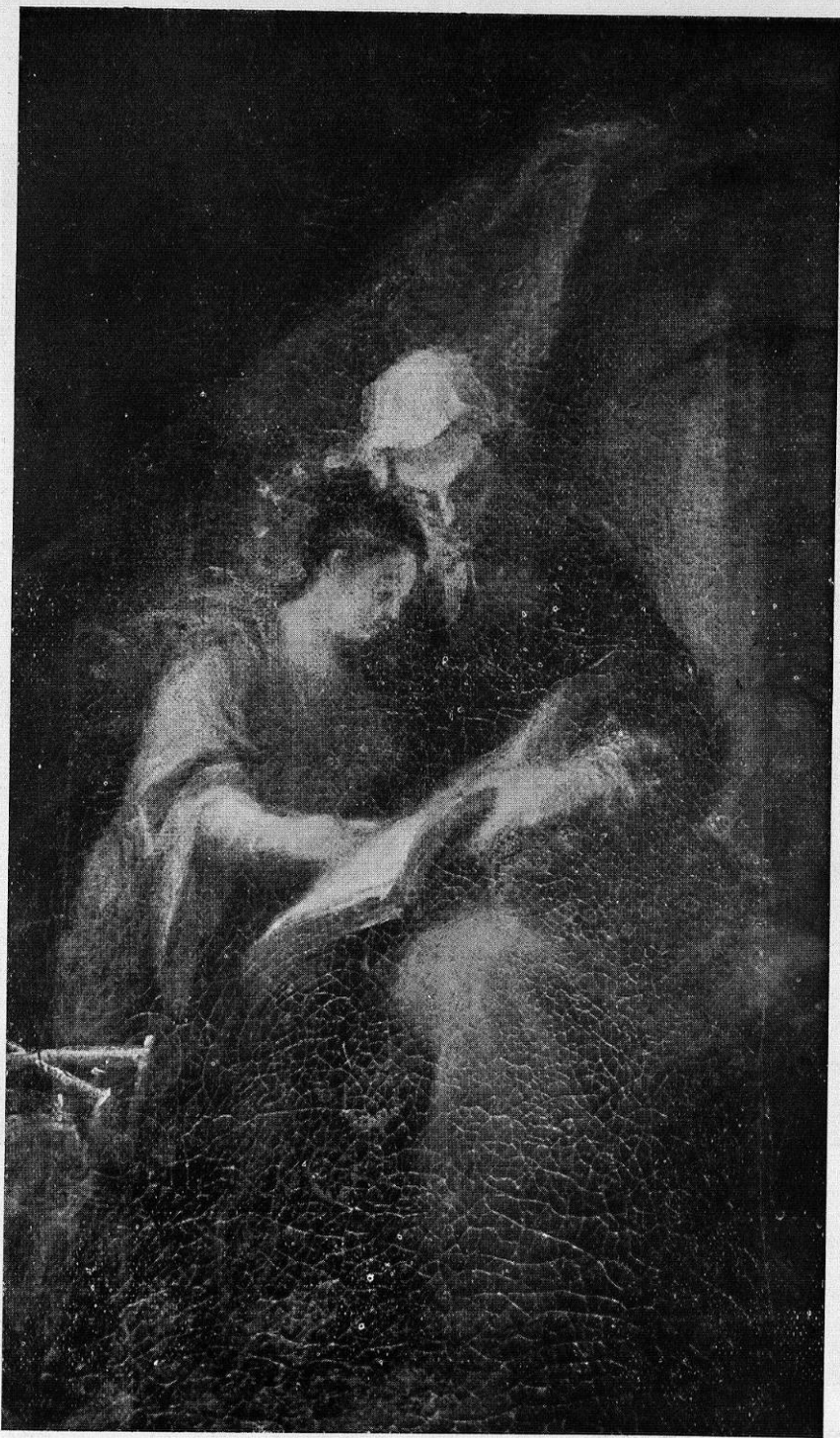
Santa Ana enseñando a leer a la Virgen María. — Pintura del Convento del Corpus Christi de Madrid.