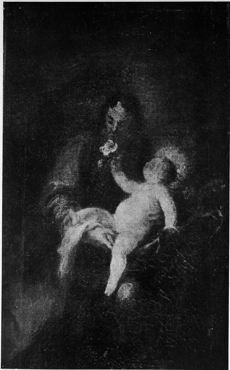
San José con el niño Jesús en los brazos.— Pintura del Convento del Corpus Christi de Madrid.