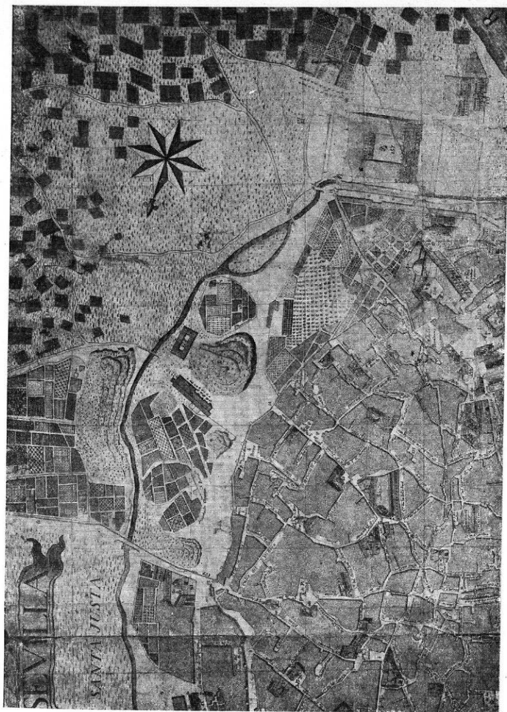
Angulo del plano de Sevilla, de Olavid, correspondiente al barrio de San Bernardo.